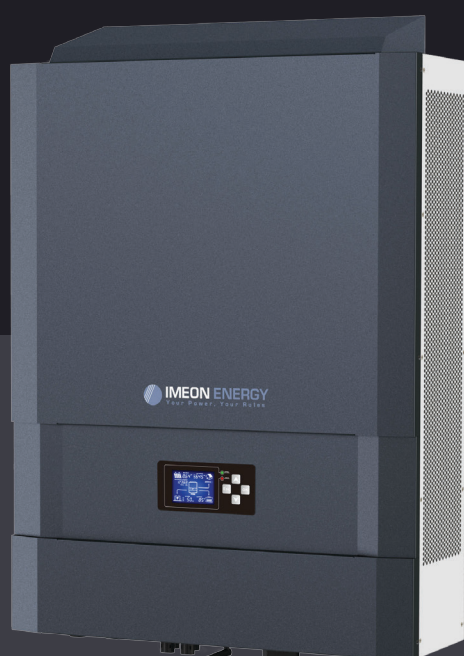
IMEON 9.12 Jusqu'à 12kWp Triphasé