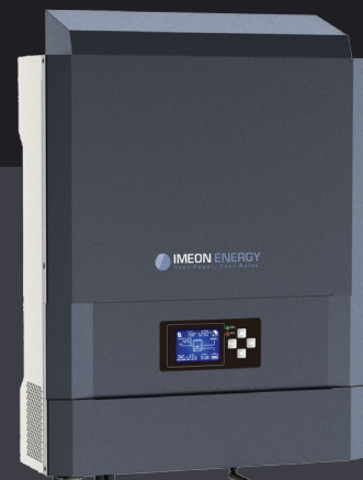
IMEON 3.6 Jusqu'à 4kWp Monophasé