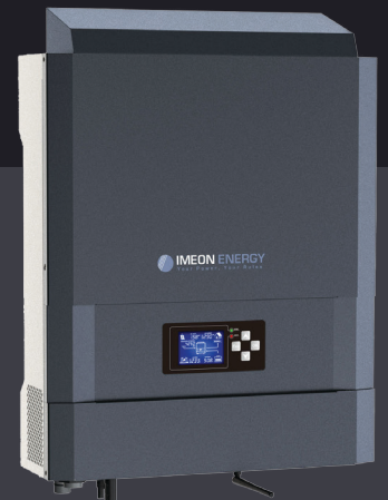
IMEON 3.6 bis zu 4kWp monophasig