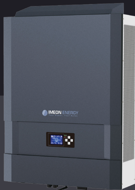
IMEON 9.12 bis zu 12kWp dreiphasig